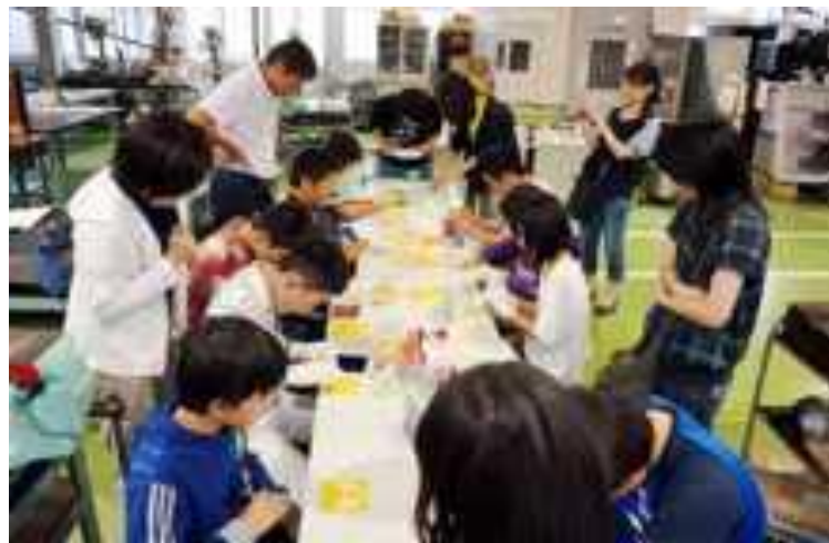
オリジナルパズル仕上げ