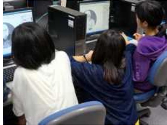
コンピュータでデザイン