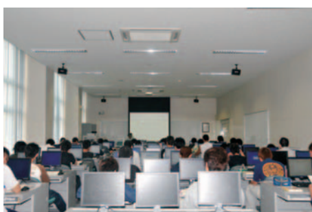
▲CAD演習室 CAD Training Room