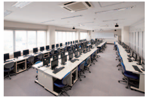
▲プログラム演習室 Program Training Room

The educational center for networking and computing service manages internal information networks and computer rooms. Computer rooms are composed of five training rooms, such as the program training room, the CAD (Computer Assisted Design) training room, the information literacy training room, the Advanced Course information training room, and the library information training room. These facilities are shared by all departments and used for information processing education, CAD (Computer Assisted Design) education, researches for graduation thesis and academic researches. In addition, information terminals can be connected to the school internal network system anywhere in our college through information outlets equipped with every classroom and wireless LAN which covers all classrooms. Our internal information network is also connected to the internet, which allows users to use e-mail, view websites and retrieve our library books.