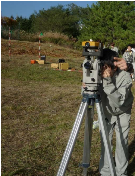
図1 測量実習における支援