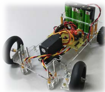
図 4 ライトレースカー