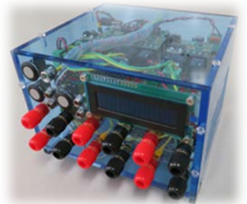
図 5 電流電圧計測装置