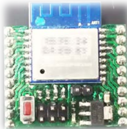
図 2 試作した基板

電子工作に興味はあるが、始め方がわからない学生やイベントのサポートをしています。