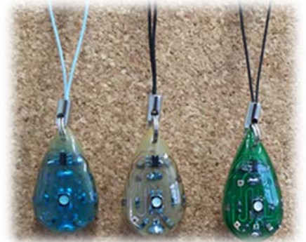
図 3 LED アクセサリ