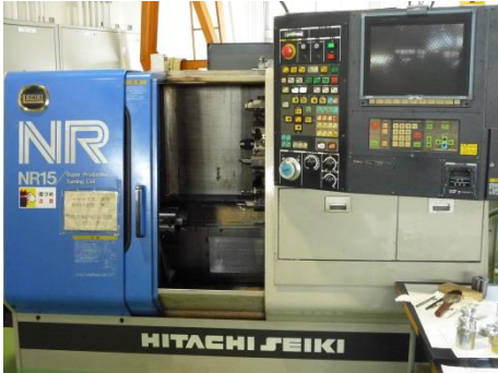
CNC 旋盤 NR15 (日立精機)