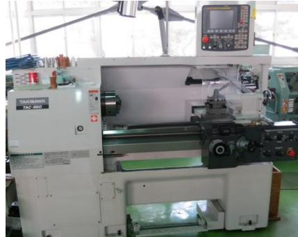
CNC 旋盤 TAC-360 (滝沢鉄工所)