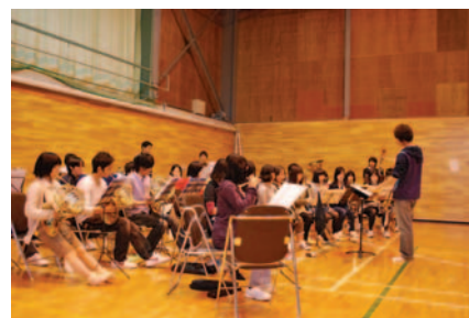
▲ 吹奏楽部 Brass Band