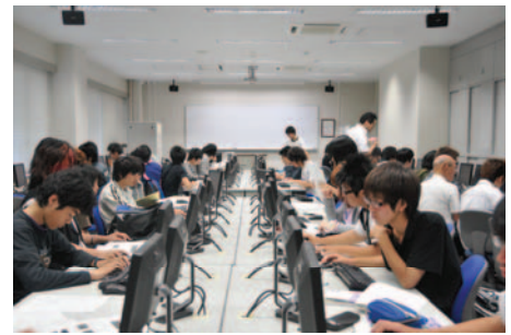
▲ プログラム演習室 Program Training Room

学術情報教育センターは、情報教育演習室、図書館、事務電算室、および学内情報ネットワークから構成されています。情報処理教育、CAD（計算機支援設計）教育および卒業研究、学術研究等に利用可能な各学科共通の施設である情報教育演習室には、パソコンが合計 200 台以上用意されており、学習や教育に大いに利用されています。また、校内のすべての部屋と共有スペースに設置された情報コンセントや、無線 LAN を通じて、校内のどこからでもパソコンを学内情報ネットワークに接続できます。学内情報ネットワークは、インターネットにも接続されていますので、電子メールの利用やホームページ閲覧、図書の検索も行うことができます。