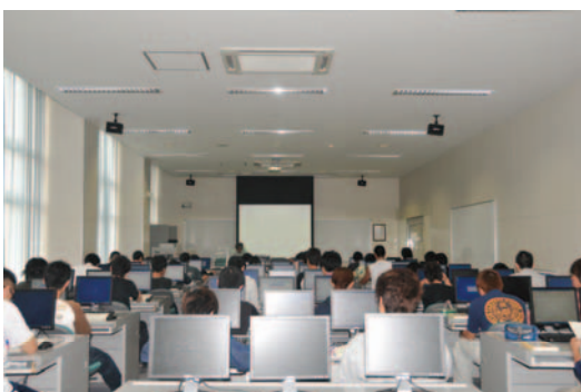
▲ CAD演習室 CAD Training Room