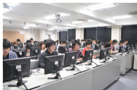
▲ 基礎情報処理演習室 Literacy Training Room