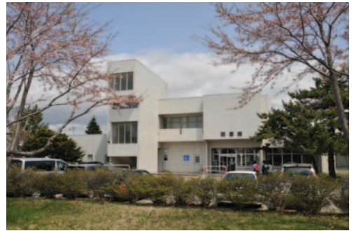
▲ 図書館 Library

The library is also open to local citizens for browsing and borrowing of materials.