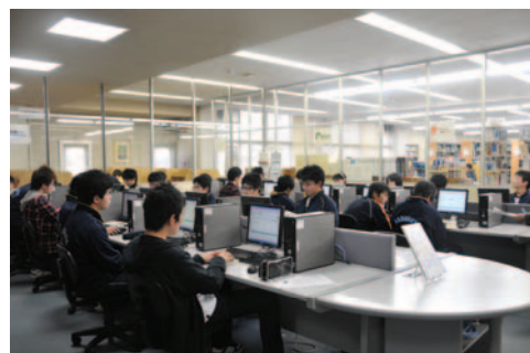
▲ 図書演習室 Library Training Room