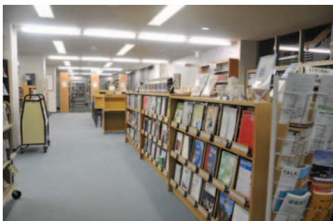
▲ 図書館内 in-Library

The library is equipped with 23 computers which offer the same environment as the CAD Training Room and the Program Training Room. The computers can be used to conduct information gathering, topic study and self-study via the internet. Access points for wireless LAN are also provided so that users can bring and use their own laptop computers. The library also has 16 portable CD players available to users. The players can be used to play material such as English listening comprehension CDs. Also available are 4 DVD/video players and a total of approximately 650 videos and other materials available for viewing.