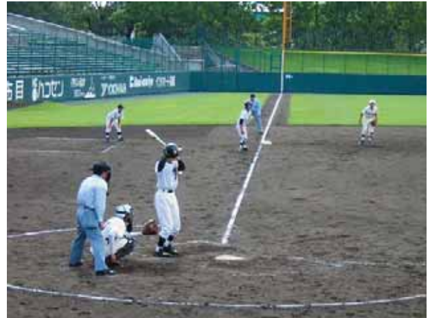
▲ 硬式野球部 Baseball