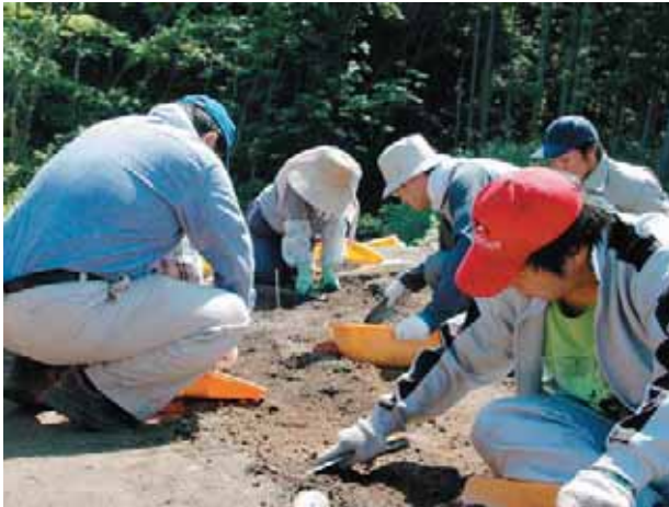
▲ 埋蔵文化財研究会 Archeology