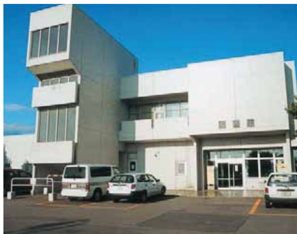
▲ 図書館 Library