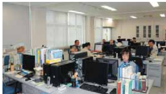
▲ 技術教育支援センター Technical Training Support Center