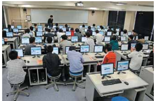
▲ 基礎情報処理演習室 Literacy Training Room