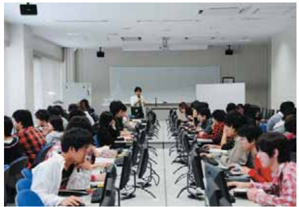
▲ プログラム演習室 Program Training Room

学術情報教育センターは、情報教育演習室、図書館、事務電算室、および学内情報ネットワークから構成されています。情報処理教育、CAD（計算機支援設計）教育および卒業研究、学術研究等に利用可能な各学科共通の施設である情報教育演習室には、パソコンが合計200台以上用意されており、学習や教育に大いに利用されています。また、校内のすべての部屋と共有スペースに設置された情報コンセントや、無線LANを通じて、校内のどこからでもパソコンを学内情報ネットワークに接続できます。学内情報ネットワークは、インターネットにも接続されていますので、電子メールの利用やホームページ閲覧、図書の検索も行うことができます。