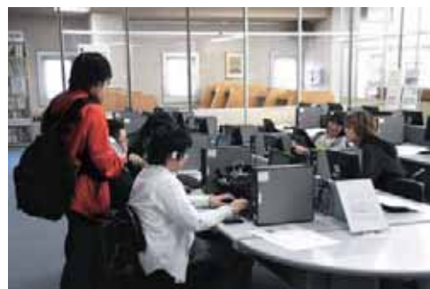
▲ 図書演習室 Training Room

CAD演習室、プログラム演習室と同環境のパソコンが23台あり、インターネットを利用した情報収集や課題学習、自習に利用できます。無線LANのアクセスポイントもありますので、個人のノートパソコンを持参して利用できる環境です。また、DVD/ビデオ機器4台とビデオ等が約650本あります。