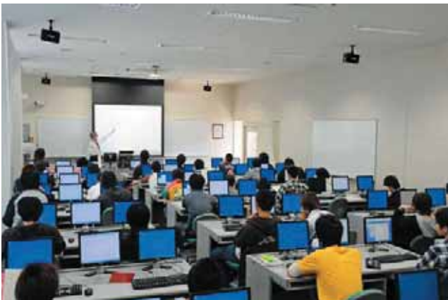
▲ CAD演習室 CAD Training Room