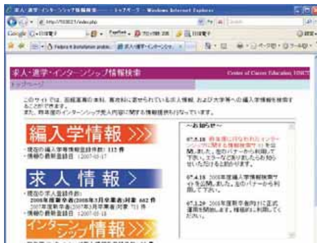
▲ 就職・進学・インターンシップ情報データベース