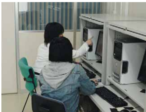
▲ 資料コーナー（データベース） Information Source