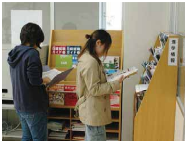
▲ 資料コーナー（書架） Information Source