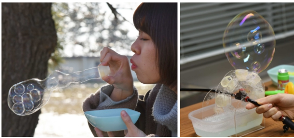
ポスタープレゼン